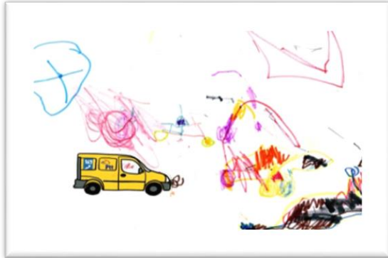
Resim 5. EK'in postacı resmi

Etkinlikler sırasında bahçıvanlıktan bahsedilmiştir. DU Resim 4'te gördüğü sulama kabını bahçıvan ile ilişkilendirebilmiştir. Düş gücünü kullanarak bahçıvanın elinde su kabı ile bir çiçeği suladığını çizmiştir. Bahçıvanlığı imgesel olarak resmetmesi ve sözlü anlatımında bahçıvanın yetiştirdiği marulları sattığından bahsetmesi ekonomik olarak ondan kazanç sağladığını, bahçıvanlığı bir meslek olarak algıladığını göstermektedir.