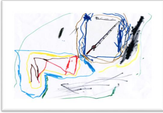
Resim7. EF'in oltası

Resim 7'de olta resmi yer almaktaydı. EF oltaya paralel olarak "balıkçı evi, küçük balık, yol ve deniz" çizdiğini söylemiştir. EF oltanın balıkçılık mesleğine ait bir malzeme olduğunu tanımıştır. Balıkçılığı coğrafi olarak denizle bütünleşik bir meslek olarak resmetmiş ve balıkçılık mesleğini tüm detayları ile tanımlamıştır. EF'in coğrafi olarak çevresel farkındalığı vardır.