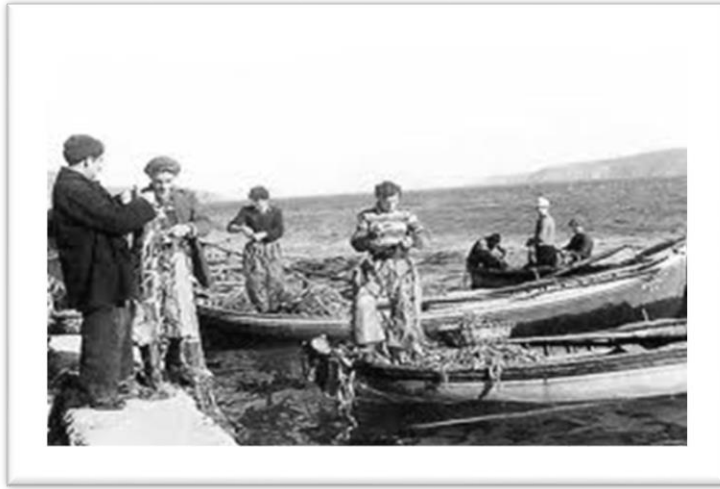
Resim 1. Eski bir balıkçı

Etkinlik sürecinde çocuklara Osmanlı Devleti ve Türkiye Cumhuriyeti’nin ilk dönemlerine ait günümüzde de devam eden geçmişteki meslek gruplarına ait resimler gösterilmiştir.