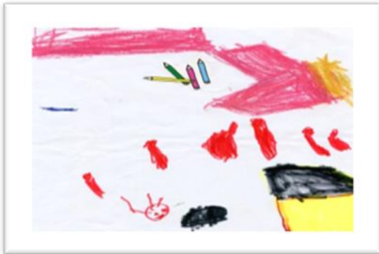
Resim 6. MU'nun Kalemleri

köpekleri kovalıyor" diye ifade etmiştir. Posta arabası, vatandaşlık eğitimi kapsamında gündelik hayatın akışı içerisinde motosikletli ve köpeklerle birlikte mekân üzerinde yerini almıştır.