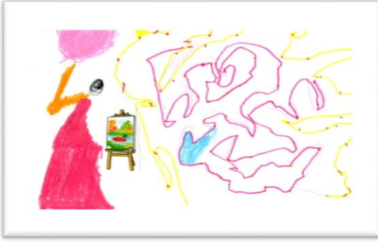
Resim 3. IR'in ressam kadın çalışması

IR'a şovale üzerinde resim olan boş bir sayfa verilmiştir (Resim 3). IR elinde fırçası olan bir ressam çizdiğini, karalamalarının ressamın paleti olduğunu belirtmiştir. Ressam etkinlikler sırasında öğrencilere gösterilen bir meslek olmamasına rağmen IR bu mesleğe dair ipucunu fark etmiştir. Mesleği düş gücünü kullanarak mekânsal ortamda imgesel olarak çizebilmiştir.